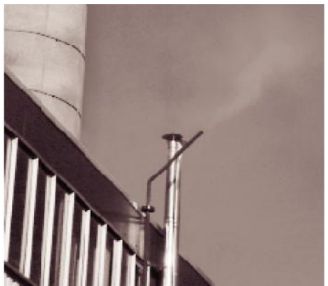
DESPUÉS DE INSTALAR TRAMPAS GEM