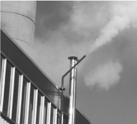
Prima degli scaricatori GEM Venturi