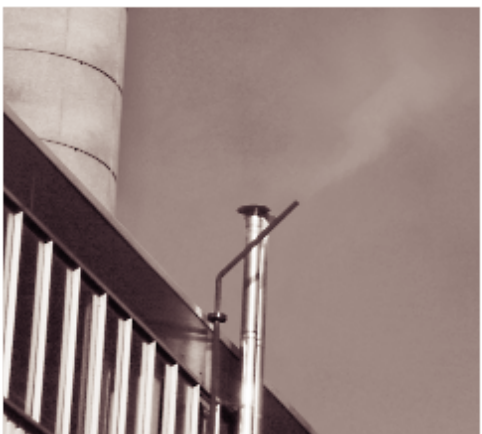
Dopo gli scaricatori GEM Venturi